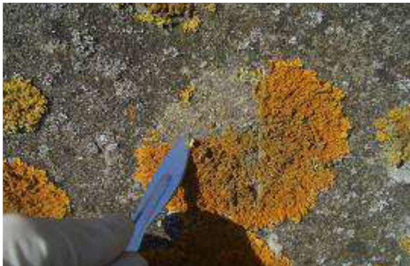
Figure 4 - Prélèvement de lichens

Le protocole opératoire ainsi que le matériel utilisé sont décrits dans les rapports de la société Aair Lichens (17 rue des Chevrettes 44470 Carquefou) à laquelle Atmo Normandie a confié les études lichéniques de son observatoire (notamment en raison d'un historique déjà disponible autour de plusieurs incinérateurs de la région). La photo ci-dessous montre l'étape de prélèvement des lichens in situ.