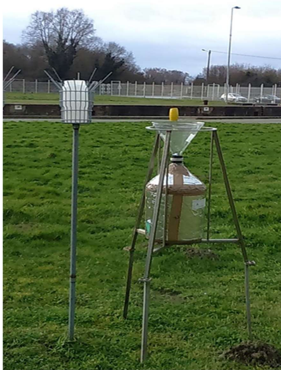
Figure 3 : Exemple de jauge OWEN et de collecteur BERGERHOFF