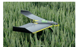
Innovation technologique (Drone)