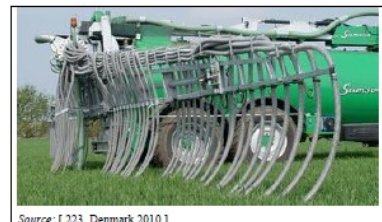
Source: [ 223, Denmark 2010 ]