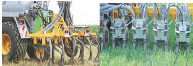
Système à disques en prairie Système à socs en cultures

L'injection vise à déposer le lisier dans une cavité formée sous la surface du sol. Le principe de la technique est de réduire le contact lisier/atmosphère en introduisant le lisier dans le sol.